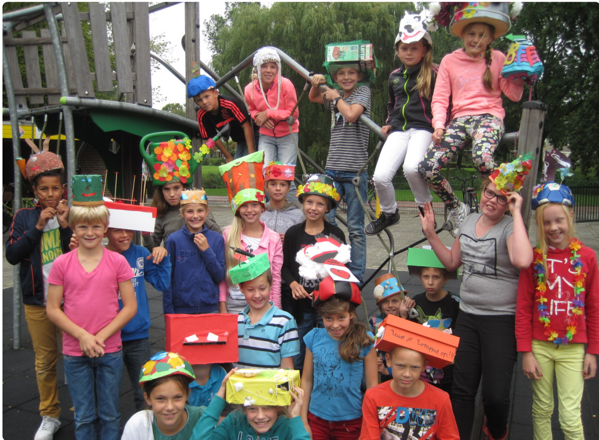
Creatief op de Willibrordschool

Er zijn vele opbrengsten. Uiteraard de resultaten, de cijfers zoals u al heeft gezien. Onderwijs is echter veel meer dan dat. Soms is dat lastig te meten; hoe gaan de kinderen met elkaar om bijvoorbeeld. Maar ook resultaten van de creatieve of wereldoriënterende vakken zijn soms moeilijk te laten zien. Op de Willibrordschool vinden deze kant minstens net zo belangrijk.